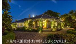
※最終入園受付は21時10分までとなります。

通常18時00分のところ21時30分まで延長開園します。異国情緒あふれる洋館のライトアップのほか、長崎港を一望できるスポットも。夏のさわやかな夜のグラバー園散策をお楽しみください。