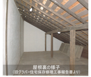
屋根裏の様子 (旧グラバー住宅保存修理工事報告書より)